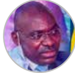
Mbole Mbole Benoit Parfait Directeur Général Des Travaux d'Infrastructures Ministère des Travaux Publics Cameroun