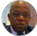
Desire Loumou Services Expert AfCFTA Secretariat